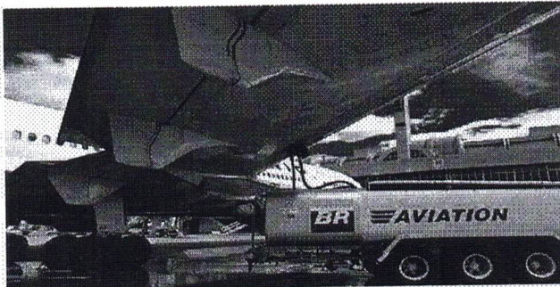
A gasolina de aviação é usada apenas em aviões de menor porte e não na aviação comercial

A BR Distribuidora decidiu suspender nesta quarta-feira (3) as vendas de gasolina de aviação após identificar problemas de qualidade no produto. A Anac (Agência Nacional de Aviação Civil) recomendou que os usuários suspendam o abastecimento caso tenham evidências de contaminação. A gasolina de aviação é usada apenas em aeronaves de menor porte e, por isso, o problema não afeta a aviação comercial. Em nota, a BR diz que está recolhendo o produto defeituoso e o substituindo por novas cargas dentro das especificações.